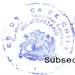
Carlos Portales Cifuentes Embajador Subsecretario de Relaciones Exteriores Subrogante

Aprovecho esta oportunidad para expresar a Ud. las seguridades de mi más alta y distinguida consideración.