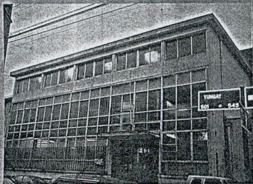
Oficina Provincial de Valdivia