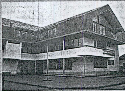
Oficina Provincial de Castro