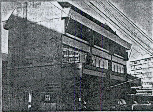
Oficina Provincial de Osorno