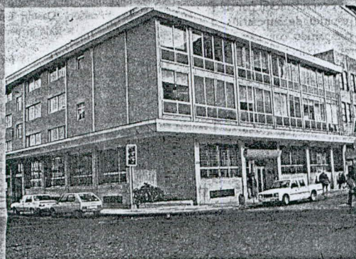
Oficina Provincial de Puerto Montt