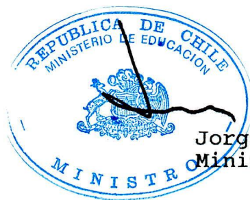
Jorge Arrate Mac Niven Ministro de Educación

Deseo el mayor éxito al Festival, a la Ilustre Municipalidad de Viña del Mar y a Ud. personalmente. Lo saluda atentamente,