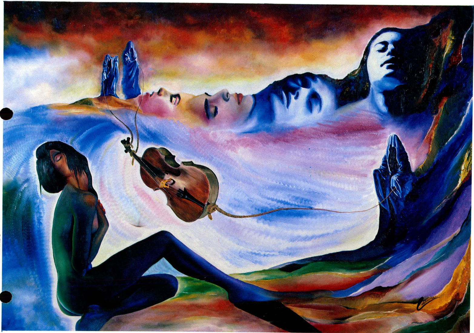
"INCITACION AL MANTRA". Oleo sobre tela (1.50 x 1.00 mts.)