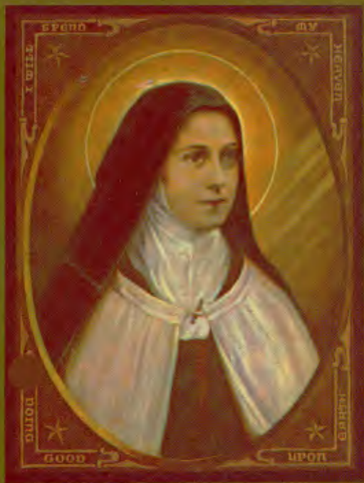
ST. THERESE OF THE CHILD JESUS