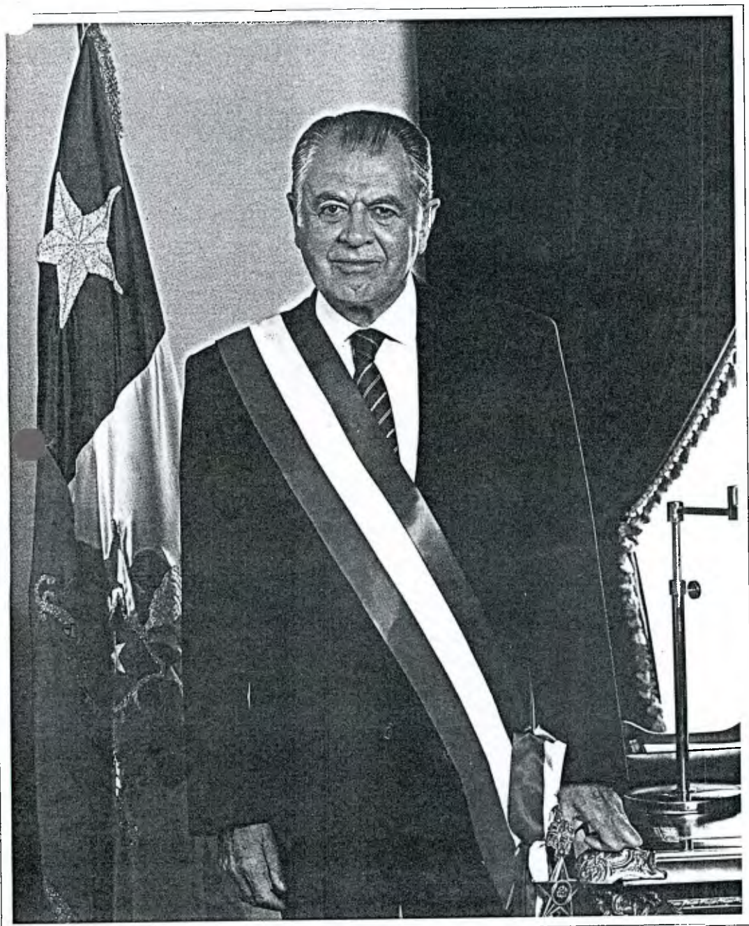
PATRICIO AYLWIN AZOCAR PRESIDENTE DE LA REPUBLICA DE CHILE