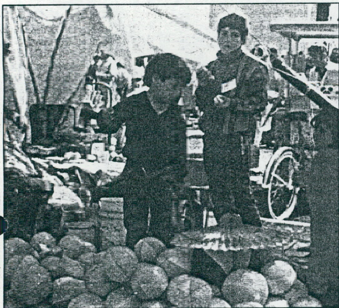
Condiciones Justas y Garantías Sociales exigen Niños que Trabajan

Acelerada Marcha del Edificio "Servicios Públicos"