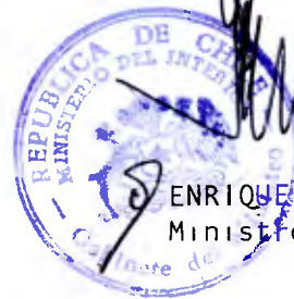
ENRIQUE KRAUSS RUSQUE Ministro del Interior

Sin otro particular y quedando a su disposición para este asunto saluda atentamente a S.E.,