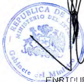
ENRIQUE KRAUSS RUSQUE MINISTRO DEL INTERIOR