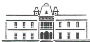
CAMPUS PARQUE ARRIETA MONUMENTO HISTÓRICO NACIONAL