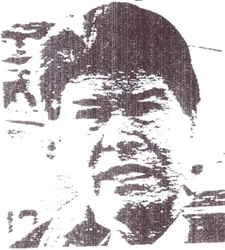
Germán Correa, ministro de Transportes.

El ministro mencionó como posibles socios al consorcio Puerto Autónomo de Valencia, Asmar y la Magallánica de Bosques, para la construcción de una instalación portuaria en Bahía Catalina con dos sitios de atraque de 250 metros cada uno y una profundidad de calado no inferior a los 12 metros. La inversión, según la información, oscilaría entre los 20 y los 25 millones de dólares.