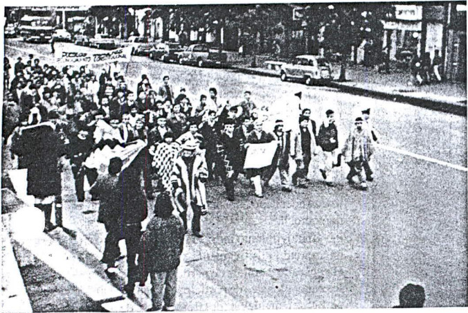
Los dirigentes cruzaron todo el centro de Valparaíso para llegar desfilando al Congreso Nacional.

había recibido en esta forma tan solemne a los representantes de las distintas etnias que habitan el territorio nacional. Señaló además la especial oportunidad en que se hacía esta ceremonia, cuando el proyecto de Ley Indígena transitaba -e indicó con sus brazos- desde el sector a su derecha del edificio, donde se sitúa la Cámara de Diputados, que lo aprobó en enero, hacía el sector de su izquierda, donde funciona el Senado, que lo está estudiando. Una ley, a su juicio muy oportuna y que permitirá el resguardo, expansión y protección de las culturas indígenas y de sus tierras