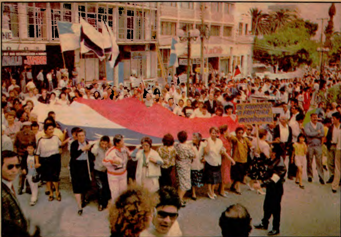
La Marcha "Arica Revive", realizada el miércoles último, constituyó una manifestación de ferviente ariqueñismo y recordó antiguas jornadas de lucha en procura de días mejores. El acto se identificó con la demanda de una nueva Junta de Adelanto, petición avalada por 15 mil firmas, y parece marcar el inicio de una etapa de combativa movilización comunitaria.