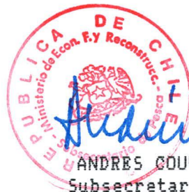
ANDRÉS COUVE RIOSECO Subsecretario de Pesca