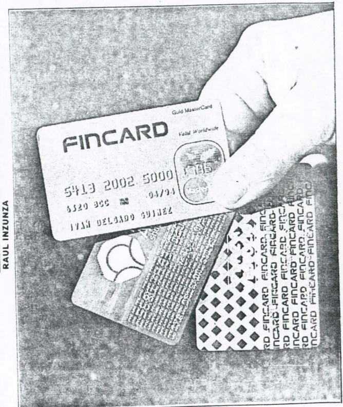
Con estas tarjetas el detenido compraba en el Parque Arauco y Plaza Vespucio.

Artículo 4°. — El que maliciosamente revele o difunda los datos contenidos en un sistema de información sufrirá pena de presidio menor en su grado medio. Si quien incurre en estas conductas es el responsable del sistema de información, la pena se aumentará en un grado."