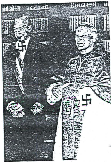
El papa y el presidente de Austria: la insondable diplomacia vaticana