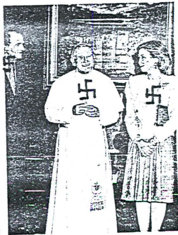
Ciudad del Vaticano, 6 de mayo - Los reyes de España, Juan Carlos I y doña Sofía, recibidos en audiencia privada por Juan Pablo II, durante el viaje de los monarcas a Italia