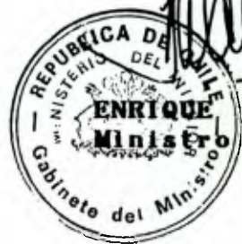
KRAUSS RUSQUE del Interior

Saluda atentamente al Honorable Senador.