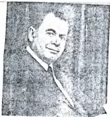
Patricio Aylwin Presidente del Senado