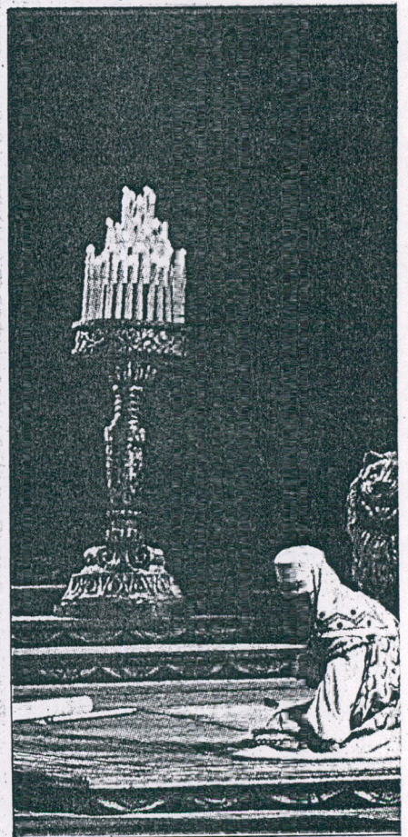
OPERA "BORIS GODUNOV"

— ROMA.— Por lo menos 250 mil personas colmaron la romana plaza de San Pedro y sus alrededores para la be-