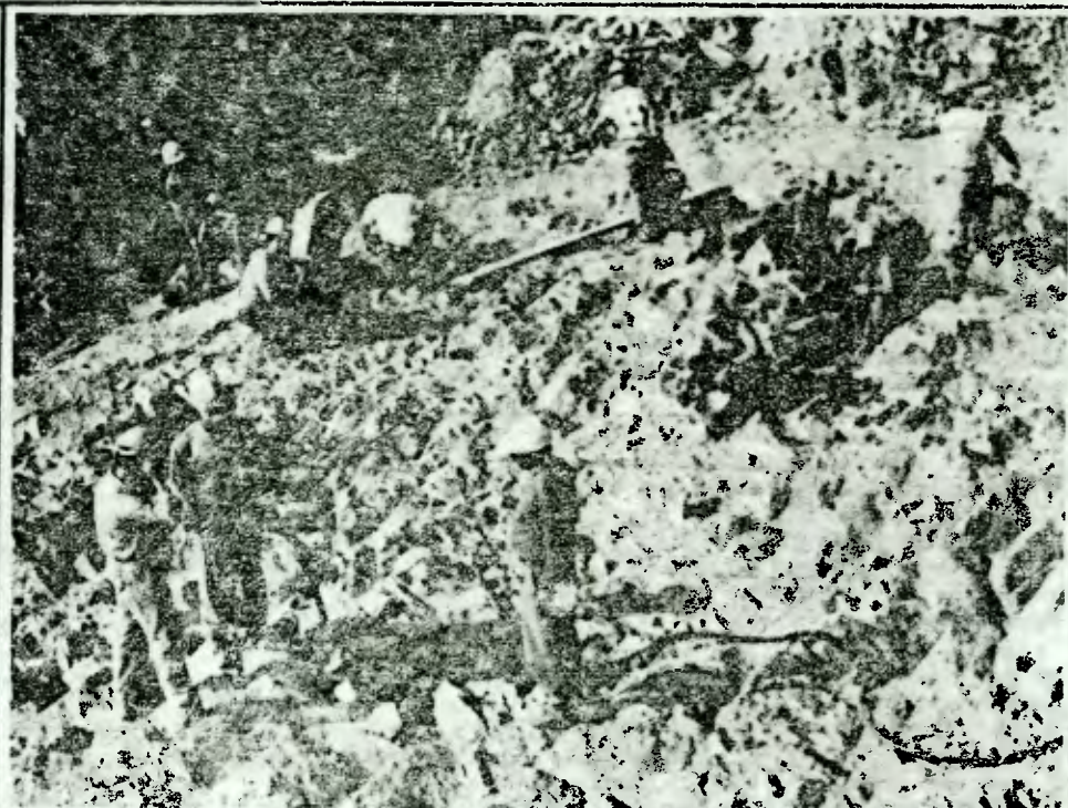
Un aspecto de los trabajos que ejecuta la firma Hartley y Compañía, principal contratista de Mitsubishi Corp., en la construcción de la futura Unidad Termoeléctrica "Nueva Tocopilla" de Chilgener. En la fotografía, los trabajos del sitio donde quedarán las calderas.

coles, está programada para las 19 horas y quienes van a integrar el Consejo Económico y Social están siendo citados mediante carta certificada para su asistencia a la Gobernación donde presta-