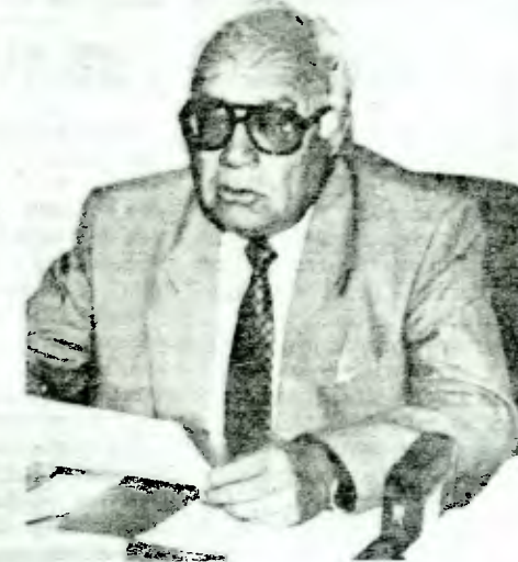
El gobernador Alfredo Castillo, comprometió su asistencia al Encuentro de Integración Física de la Subregión a efectuarse en Iquique.

Esta con el propósito de superar las actuales trabas a la integración económica, proponer a los gobiernos centrales las medidas administrativas y legislativas tendientes a facilitar el libre tránsito de medios de transporte y de personas; Crear complejos fronterizos conjuntos de aduana, control fitosanitario y policía internacional; Instalar cámaras de fumigación y radiación fitosanitaria y zonas de cuarentena conjuntas; Instalar consulados en zonas de frontera.