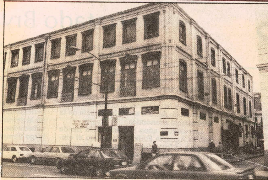
SEDE DE LOS ESTIBADORES. — Para el próximo 21 de abril, a las 16 horas, en el Sexto Juzgado Civil de Valparaíso, está fijado el remate de esta sede del Sindicato de los Estibadores de Valparaíso,